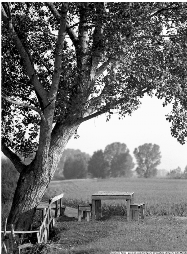
Canale del Terzo - punto di sosta tra il porto di Cavallara ed il porto delle Morette

Sede Convegno Istituto Tecnico Agrario Statale Dionisio Anzilotti Via Ricciano n.5 - 51017 Pescia (PT)